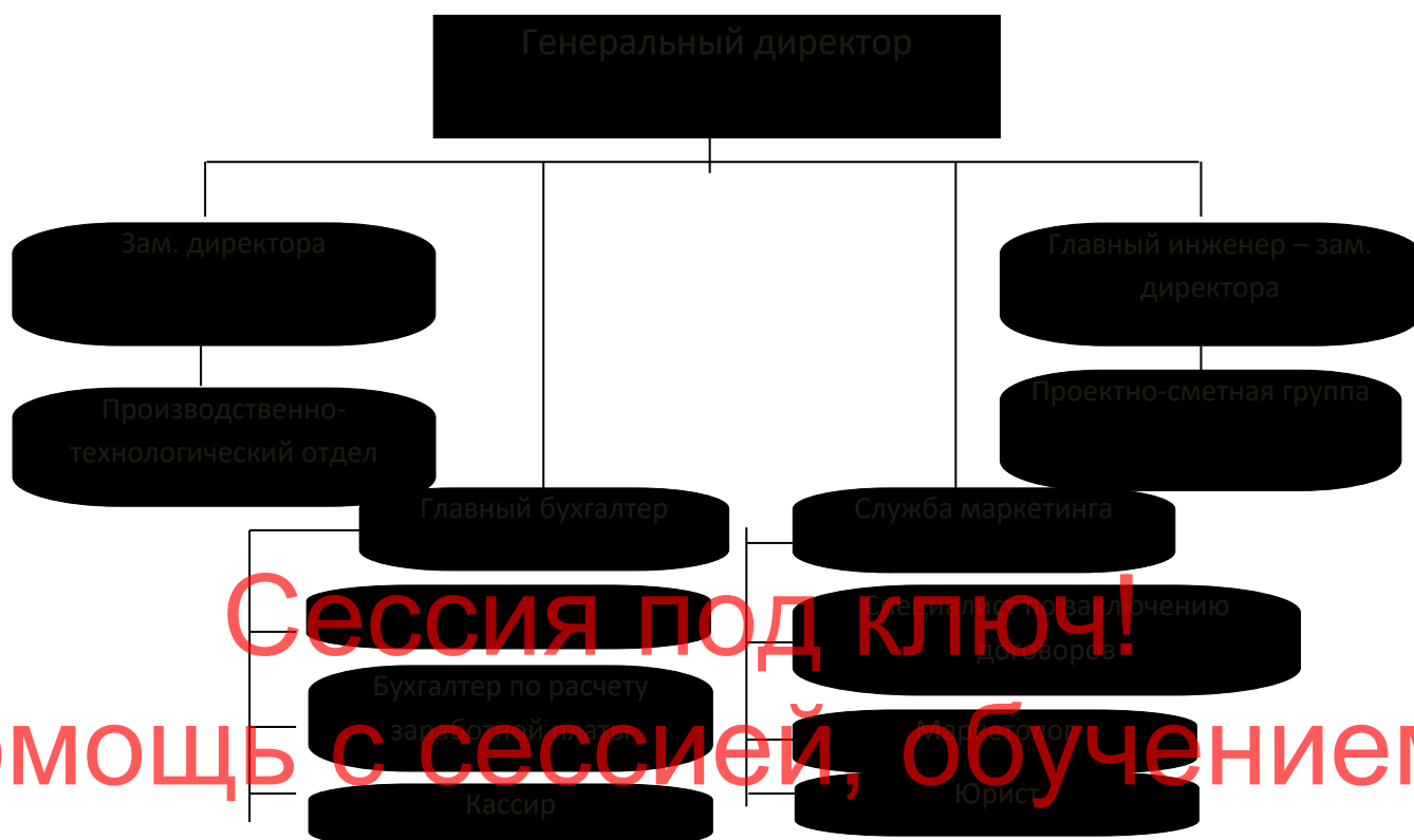
Рисунок 1. Организационная структура управления ООО «ПК ВентКомплекс»