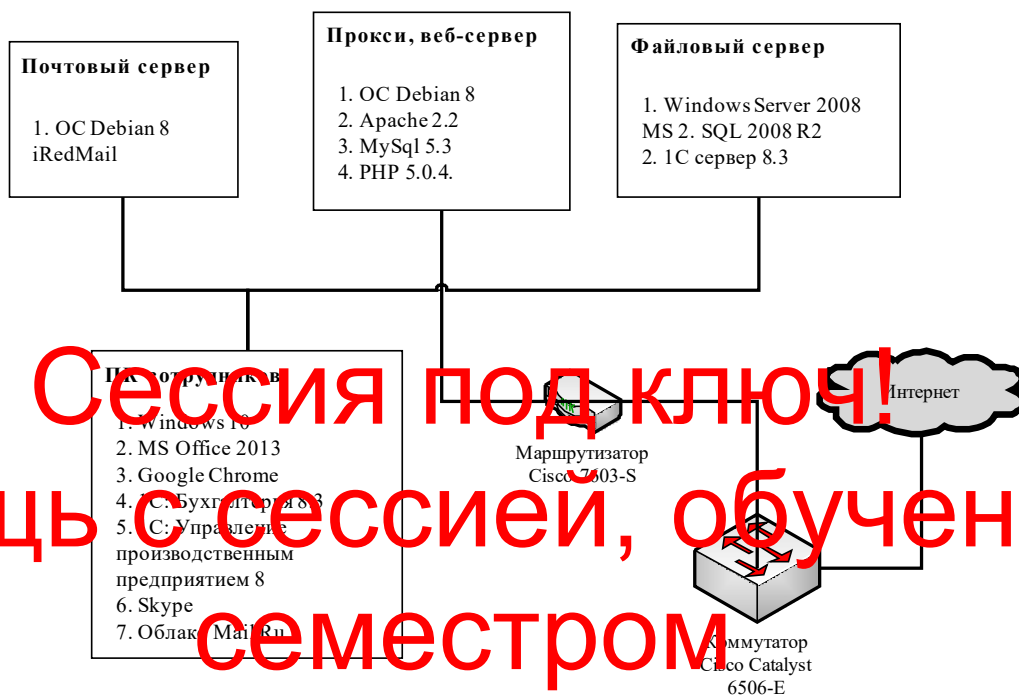
Рисунок 2. Программная архитектура предприятия ООО ПК «Венткомплекс»

Программная архитектура предприятия ООО ПК «Венткомплекс» представлена на рисунке 2.